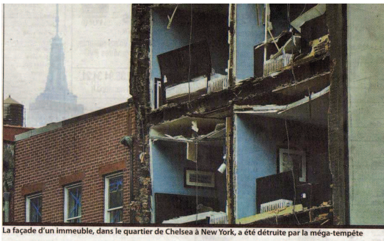
La façade d'un immeuble, dans le quartier de Chelsea à New York, a été détruite par la méga-tempête

OURAGAN. A New York, au moins dix personnes ont été tuées et des centaines de milliers de personnes se sont réveillées hier les pieds dans l'eau ou sans électricité.