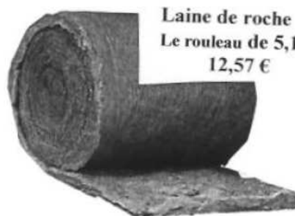
Laine de roche Le rouleau de 5,10 m 12,57 €