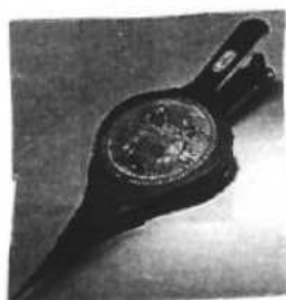
Le soufflet 31,90 €