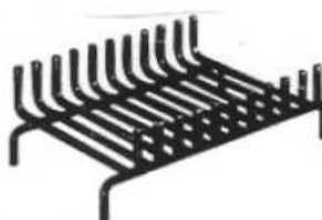
Le porte-bûches 99,50 €