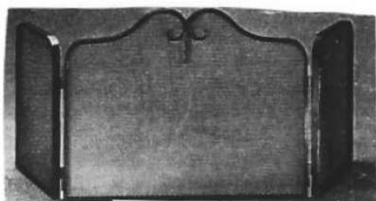
Le pare-feu 112 €