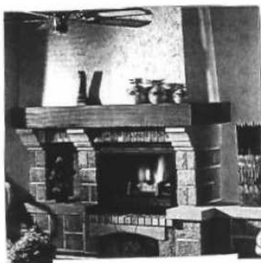
Cheminée BODIN 1 496 €