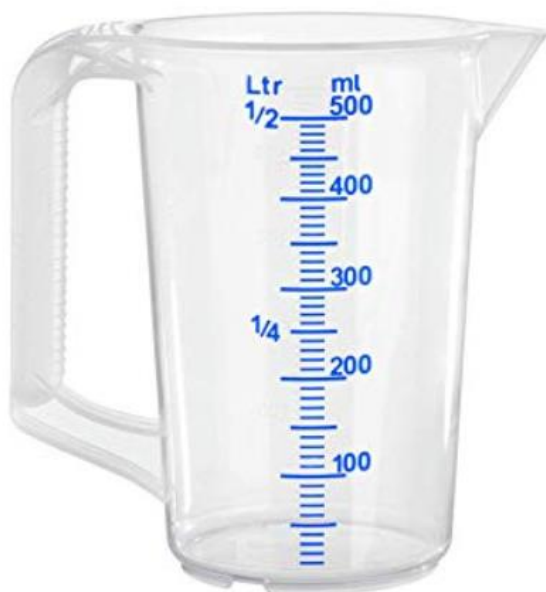
Mesure de la quantité d'eau

Dessiner le trait de remplissage pour chaque ingrédient.